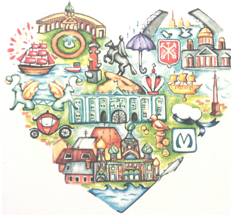
Motiv einer Postkarte

Sankt Petersburg – liebevoll von den Bewohnern пите́р genannt – ist eine sehr eindrucksvolle und historische Stadt. Im Zentrum kann man an jeder Straßenecke viele kunstvolle Bauten entdecken, die mich jedes Mal fasziniert haben. Jede Metrostation ist ein Kunstwerk für sich. Sogar die Bewohner sind sehr stilsicher und elegant gekleidet. Ich muss zugeben, dass mich keine andere Stadt bisher so in den Bann gezogen hat. Deshalb empfehle ich diese Stadt sehr! Neben dem Uni-Alltag habe ich auch viel Zeit gehabt die 5-Millionen-Stadt zu erkunden und mich mit neu Stadt zu amüsieren. Die Kosten liegen im außergewöhnlichen Cafés und Die Kosten liegen im Deutschland, aber man sollte achten. Als Student sollte man Ausweis dabei haben, da viele Studentenrabatte vergeben. geben kann, ist die Website werden viele Veranstaltungen sind. Ebenso werden gute etc. abgegeben. Wichtig ist Russisch lesen kann. Sonst russisch-sprachigen Übersetzer, um Hilfe. Welche atemberaubende Gebäude es dort gibt, werdet ihr bestimmt vorab im Internet recherchieren. Vielleicht erkennt ihr die Sehenswürdigkeiten wieder, die auf der Postkarte oben abgedruckt worden sind. Ein kleiner Tipp noch: die wunderschönen Fontänen des Petershofs sind ab Mitte September nicht mehr im Betrieb. Also am besten gleich diesen Palast als Erstes besuchen.