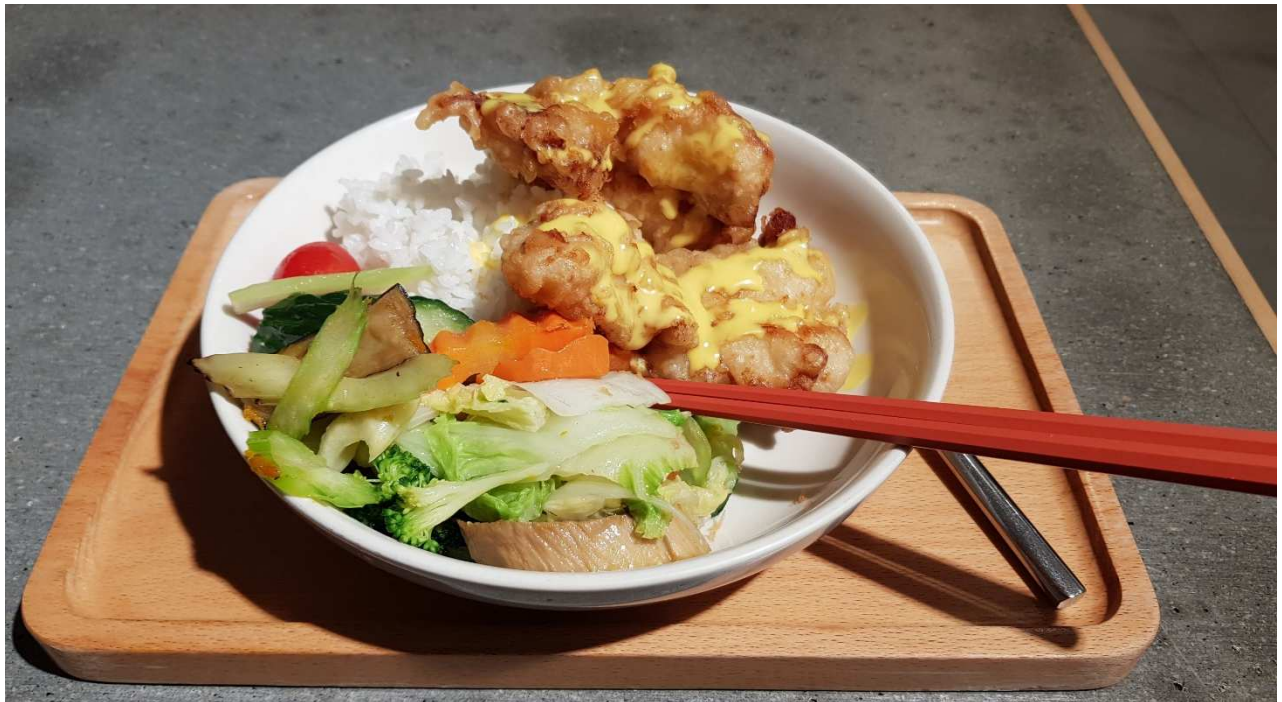
Mittagessen in der Kantine "Paper & Coffee"

Küche an, es ist auf jeden Fall für jeden was dabei. Die meisten Kantinen haben von morgens bis 20 oder 21 Uhr am Abend geöffnet, sodass ihr dort auch problemlos alle Mahlzeiten des Tages einnehmen könnt.