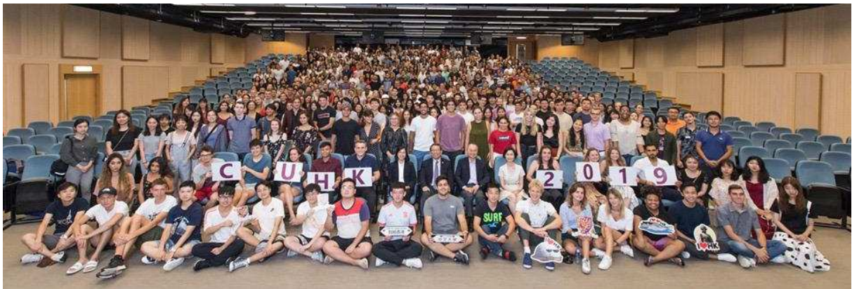
Begrüßungsfoto in der Orientierungswoche

In der Einführungswoche bekommt ihr allerhand Informationsblätter, eure Studentenkarte und es gibt einige Einführungsveranstaltungen. Hier kann man gut die ersten Kontakte knüpfen. Das ist auch hilfreich, weil man oft ähnliche Fragen hat. Wir hatten mit über 300 Austauschstudenten eine große Whatsapp Gruppe, in der allgemeine Anliegen geklärt wurden.