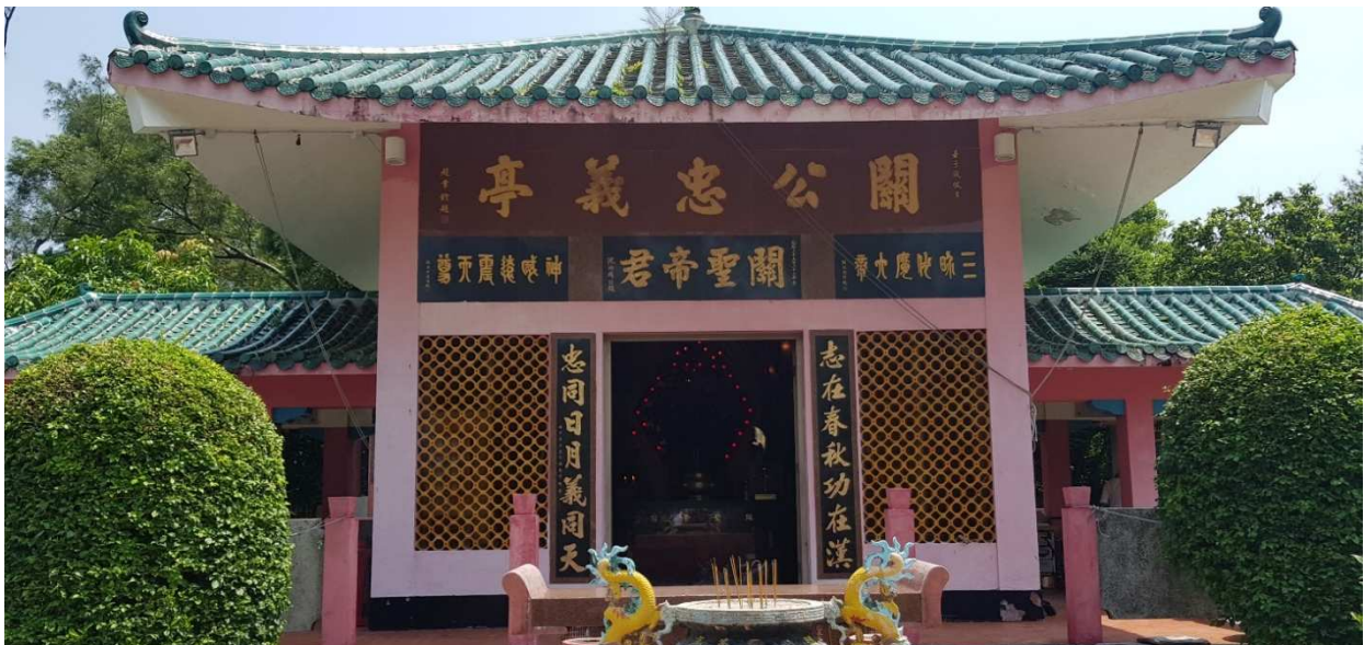
Tempelanlage auf Cheung Chau Island

Darüber hinaus hat HK mehr als 200 Inseln, die teilweise besiedelt sind. Mit Fähren kann man Lamma Island oder Cheung Chau schnell erreichen und bei gutem Wetter an einem der vielen Strände entspannen.