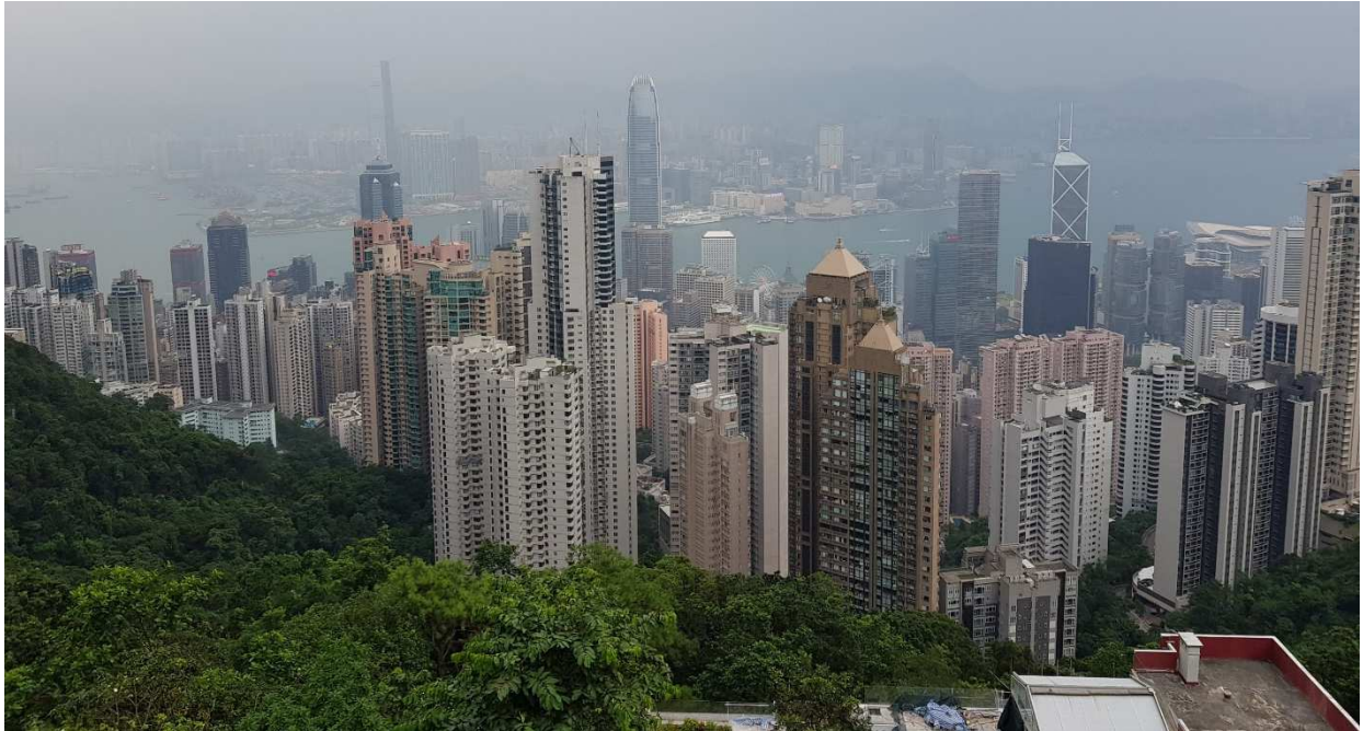
Ausblick vom "Victoria Peak"

Natürlich hält auch die quirlige City tolle Freizeitmöglichkeiten bereit. Ein Muss für jeden Austauschstudenten sind natürlich die Klassiker Victoria Peak, die Lichtershow an der Avenue of Stars sowie eine Fahrt mit der Star Ferry mit Blick auf die eindrucksvolle Skyline. Aber auch abseits der typischen Touristenspots gibt es viele interessante Dinge zu entdecken. So lohnt es sich, einfach mal über die lauten und hektischen Märkte in Mong Kok oder Tai Po zu schlendern, den Big Buddha auf Lantau Island zu besuchen oder einen Drink in einer der dutzenden Rooftopbars in schwindelerregender Höhe zu genießen.