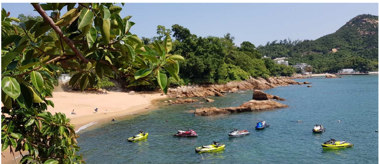
"Stanley Beach" auf Hong Kong Island