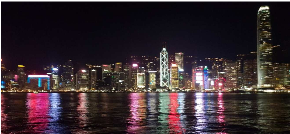
Skyline vom "Victoria Harbour" aus

Wenn ihr Abenteuer und eine neue Kultur erleben wollt, ist Hong Kong genau der richtige Ort für euch. Auch braucht man keine Angst haben, in Zukunft nach Hong Kong zu reisen. Die mediale Berichterstattung ist deutlich extremer als die Situation vor Ort und man braucht sich keine Sorgen um die eigene Sicherheit zu machen.