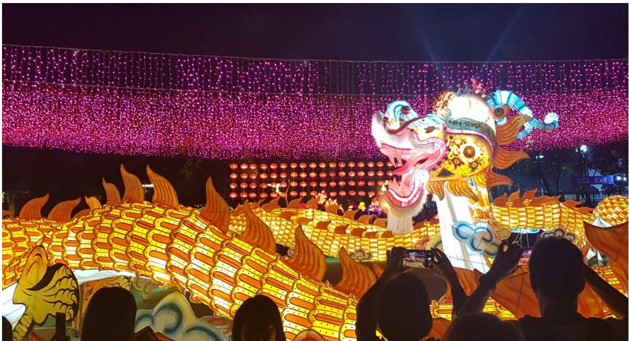
Parade beim "Mid Autumn Festival"