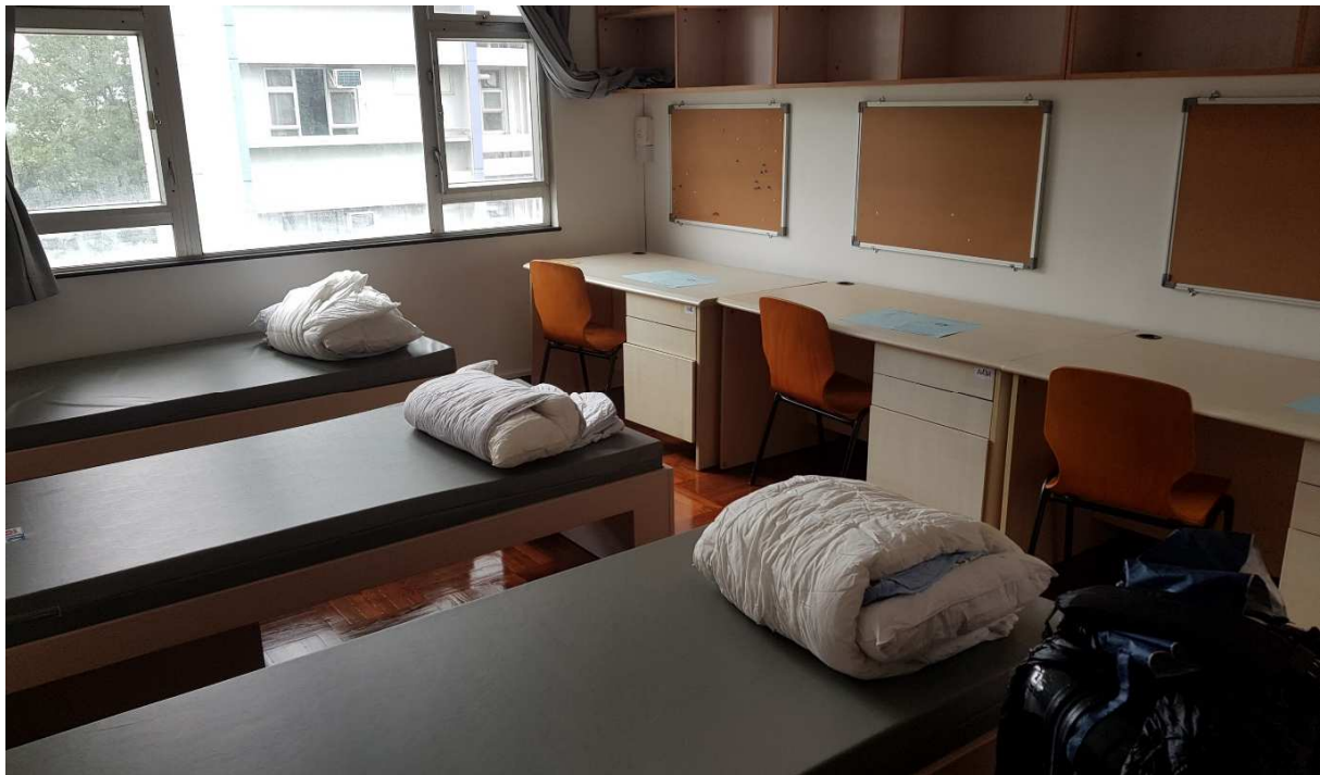
Unser Zimmer im International House

Die Universität ist nach US-amerikanischem Beispiel in neun Colleges gegliedert. Ihr werdet auch einem College zugeordnet. Dies hat für die Austauschstudenten im Alltag nicht besonders große Auswirkungen, außer dass ihr gewisse Vorzüge des jeweiligen Colleges genießen dürft (Vergünstigungen in der College Mensa, Nutzung der Räumlichkeiten und Teilnahme an internen Veranstaltungen). Außerdem bekommt ihr vorab die Unterkunft mitgeteilt. Die meisten Austauschstudenten mussten ihre Unterkunft nach der Orientierungswoche noch einmal wechseln, ich durfte zum Glück in meiner bleiben. In der Regel sind es 2er oder 3er Zimmer, die ihr euch mit anderen Austauschstudenten oder Locals teilt. Die Zimmer sind nicht luxuriös eingerichtet und eignen sich auch nicht zum Lernen, aber ihr werdet dort sowieso die wenigste Zeit verbringen. Die Waschräume müsst ihr euch mit noch mehr Leuten teilen. In meinem Fall waren es drei kleine Badezimmer für 16 Leute. Hinzu kommt eine Gemeinschaftsküche. Waschen könnt ihr in den Unterkünften auch.