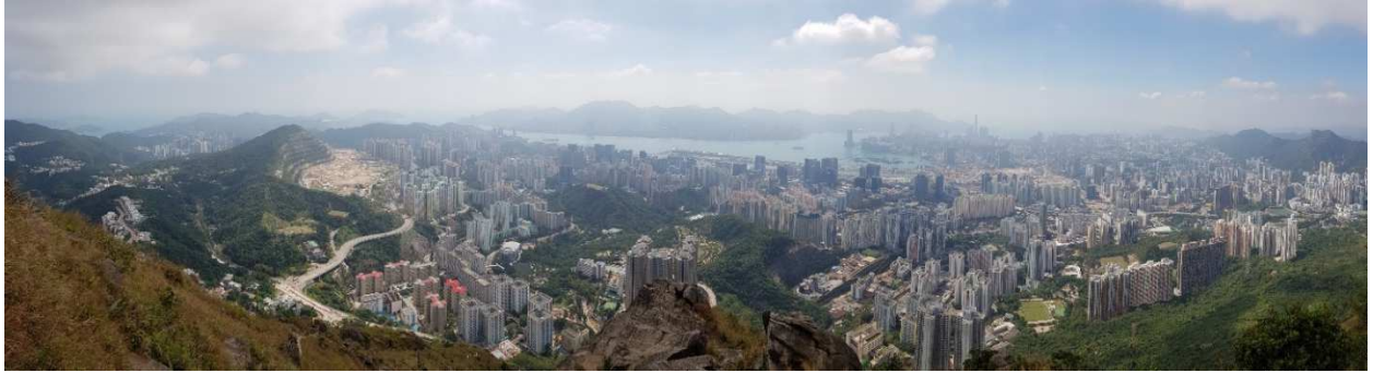
Ausblick über Hong Kong vom "Suicide Cliff"

Darüber hinaus hat HK mehr als 200 Inseln, die teilweise besiedelt sind. Mit Fähren kann man Lamma Island oder Cheung Chau schnell erreichen und bei gutem Wetter an einem der vielen Strände entspannen.