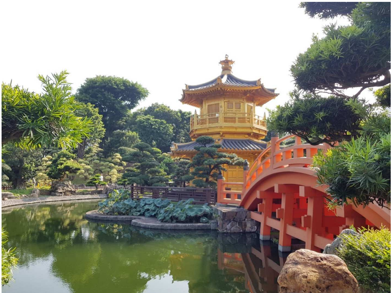
Nan Lian Garden in Hong Kong

Kulinarisch solltet ihr euch auch von den vielen verschiedenen Möglichkeiten in HK überzeugen lassen. So dominieren natürlich kantonesische Restaurants das Straßenbild in den meisten Vierteln, allerdings findet man auch sehr viele andere, vor allem asiatische Küchen auf Hon Kongs Straßen – japanische, koreanische, vietnamesische Restaurants halten diverse Leckereien bereit. Außerdem ist Hong Kong ein Paradies für Shoppingliebhaber. Ich habe noch nie eine Stadt mit so vielen Malls gesehen. Überall sind Malls – fast über jeder größeren MTR Station ist eine Mall und man bekommt das Gefühl, dass Shopping bei den Bewohnern Hong Kongs zum festen Wochenritus gehört.