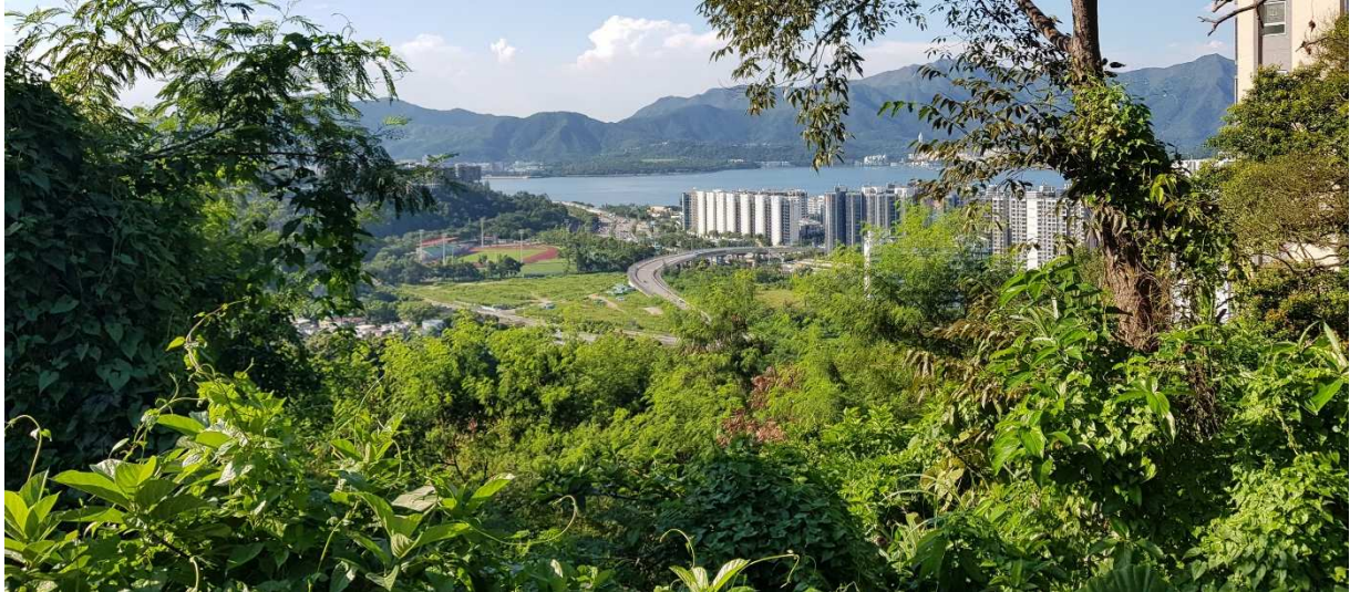
Blick auf den Campus

In der Einführungswoche bekommt ihr allerhand Informationsblätter, eure Studentenkarte und es gibt einige Einführungsveranstaltungen. Hier kann man gut die ersten Kontakte knüpfen. Das ist auch hilfreich, weil man oft ähnliche Fragen hat. Wir hatten mit über 300 Austauschstudenten eine große Whatsapp Gruppe, in der allgemeine Anliegen geklärt wurden.