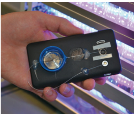
Smartphone-gestützter optischer Schnelltest-Sensor für die medizinische Diagnostik.

Am 19. April 2018 konnten 30 Alumni hautnah erfahren, womit sich das Hannoversche Zentrum für Optische Technologien, kurz genannt HOT, aktuell beschäftigt. Das fachübergreifende Forschungszentrum der Leibniz Universität Hannover betreibt Forschung und Lehre auf dem Gebiet der angewandten Optik und Photonik.